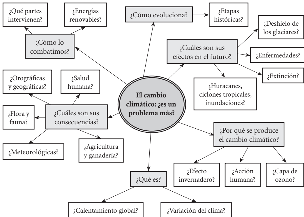
Figura 1. Red de problemas de la UD global: "Cambio climático". López Ruiz et al. (2007).

“elástico”. Pero el mapa elaborado es útil para no perderse en ese nuevo territorio que se va a explorar. La diagramación y ordenación de los contenidos en red posibilita acceder al conocimiento escolar entrando por cualquier nodo o concepto-clave y siguiendo diferentes rutas de aprendizaje. La enseñanza que se deriva puede establecer distintos itinerarios didácticos –secuencias de actividades diversas–, dependiendo de los intereses y los conocimientos previos de los alumnos.